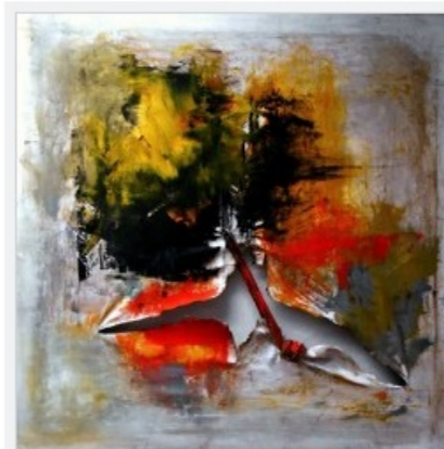
Infernal dreams, tecnica mista, 80 x 80 cm, 2014